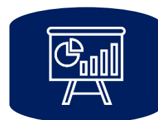
Gestión de proyectos

En el 2019 dentro del pilar organizacional nos propusimos fortalecer nuestra gestión humana, específicamente en el proceso de actualización de roles y funciones, y la selección, retención y desarrollo del talento; así como visibilizar nuestra línea Responde Social .